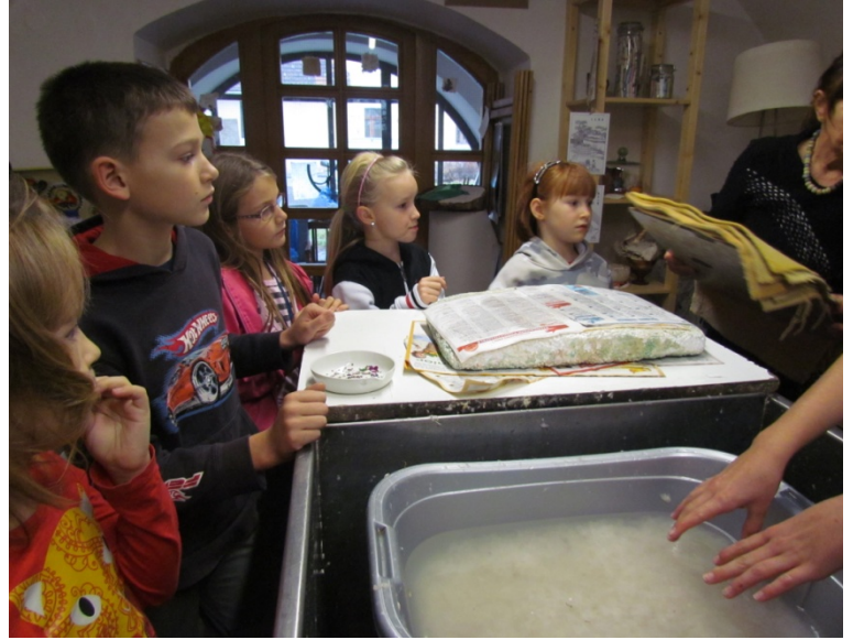
Exkurze do dílny ručního papíru.