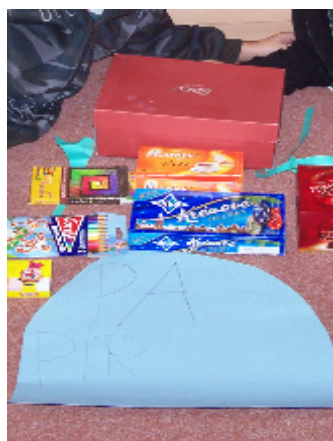
Brainstroming – nápady k recyklaci papíru včetně praktické ukázky papírového odpadu.