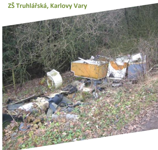
ZŠ Truhlářská, Karlovy Vary