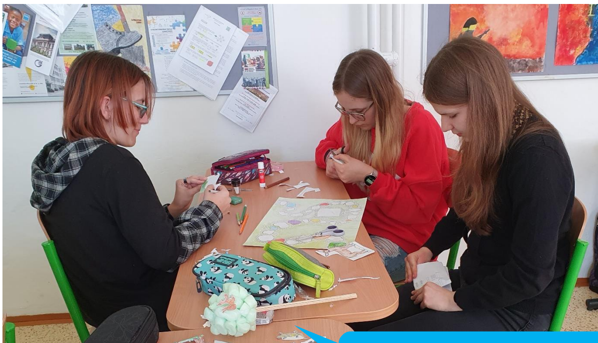
Základní škola Velký Ořechov, okres Zlín