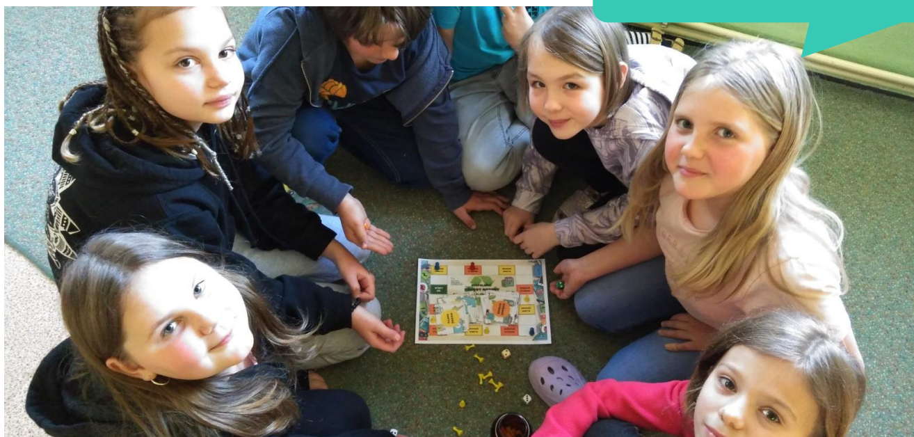
Základní škola Jalůvčí