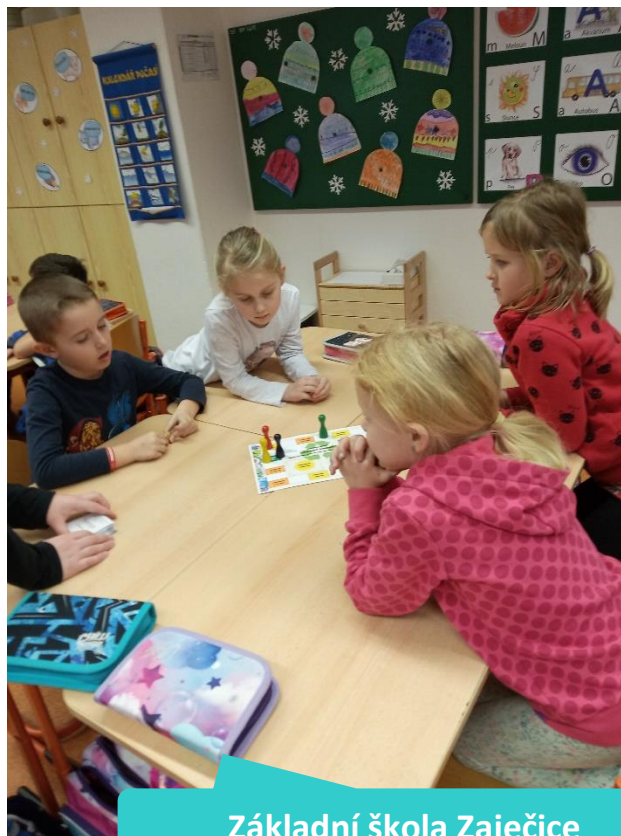
Základní škola Zaječice