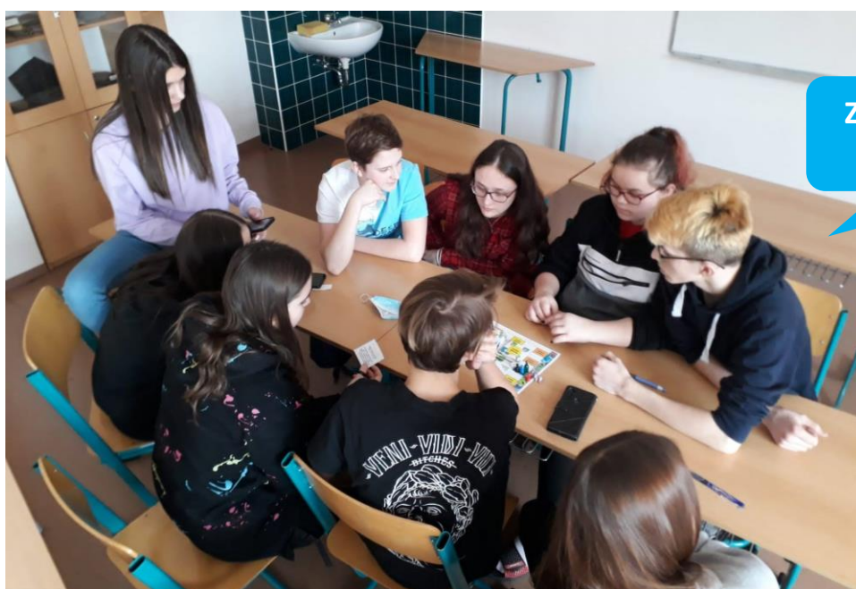
Základní škola Dr Františka Ladislava Riegra, Semily