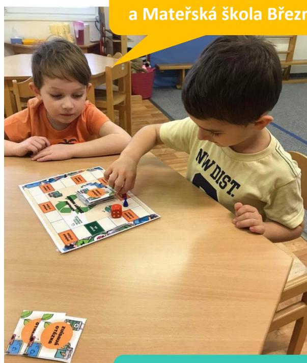
Základní škola a Mateřská škola Březno