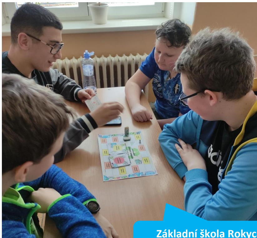
Základní škola Rokycanova, Sokolov