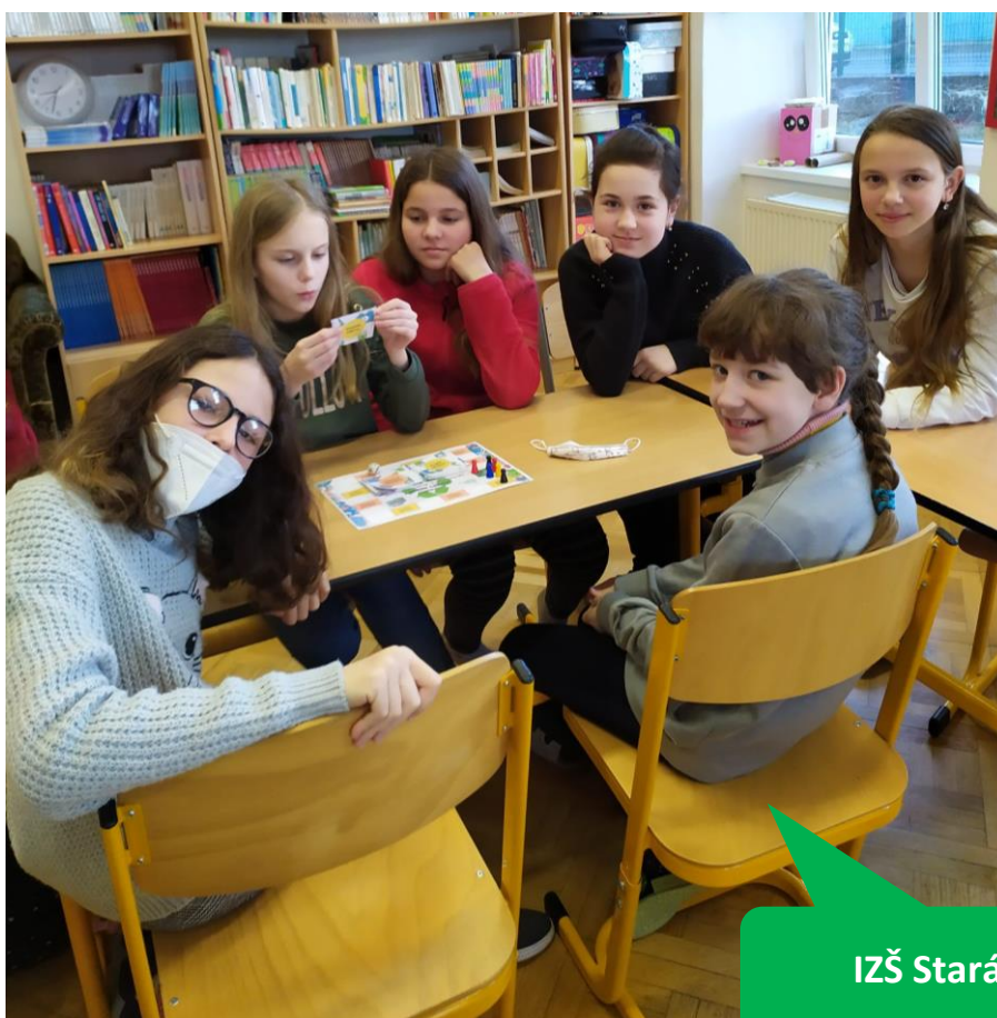
IZŠ Stará Huť