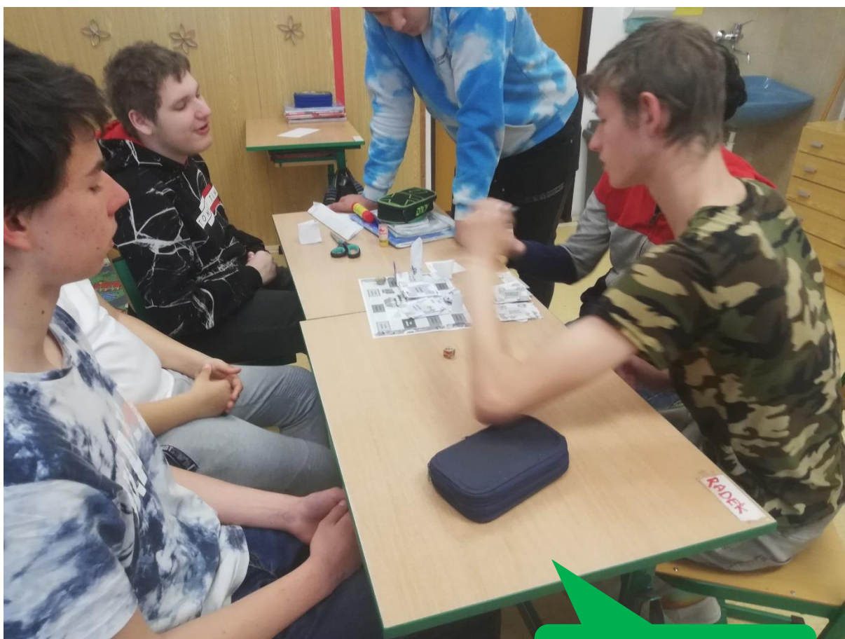
SŠ a ZŠ Tišnov