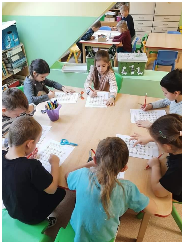
Základní škola a mateřská škola Bečov, Motýlci