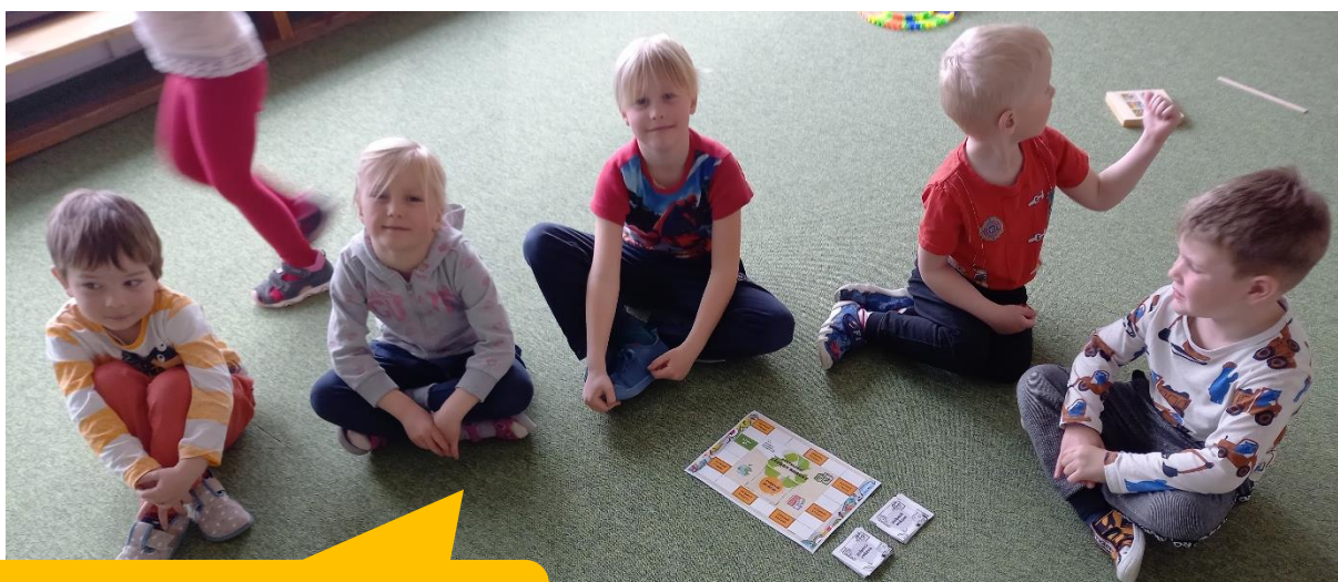
Mateřská škola Staré Hradiště, okres Pardubice