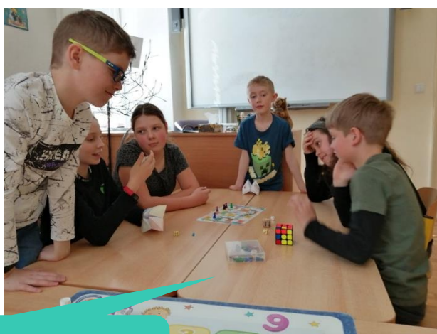
Základní škola a Mateřská škola Dobrá voda