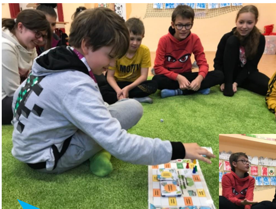
Základní škola Bruntál, Školní