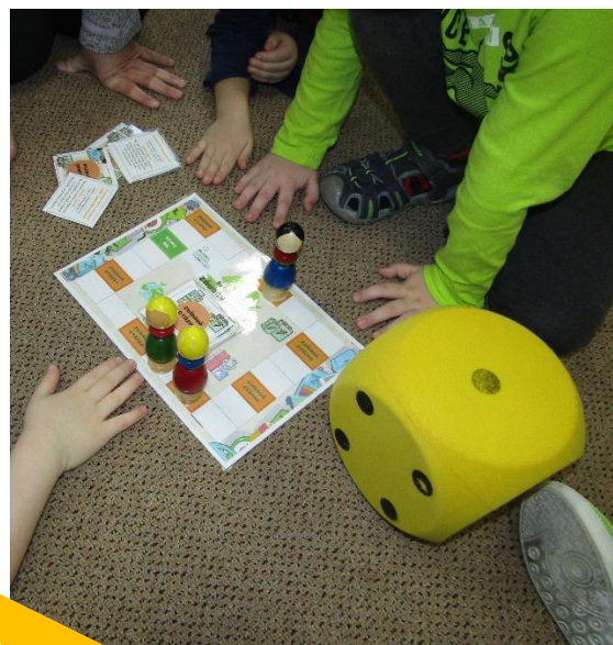
Speciální základní a mateřská škola Kladno