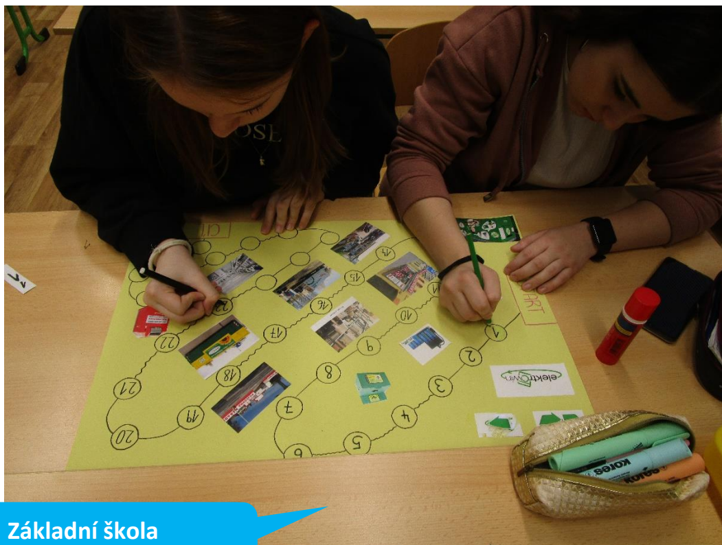
Základní škola Týnec nad Labem